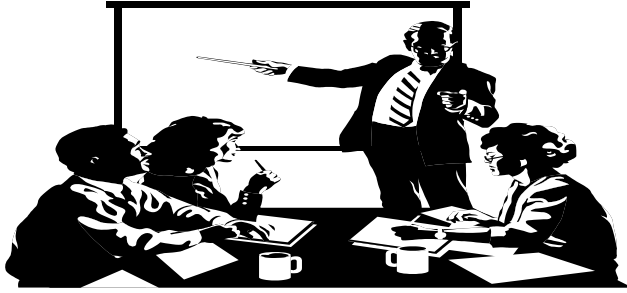
İŞ HAYATIMIZDAKİ KRİTERLERİMİZ NELER ?

“Neleri yapmaktan mutlu oluyorum ?” sorusunun cevabı ilgilerimizi gösterir. Mesleğimizin gerektirdiği özelliklerle ilgilerimiz benzeştiği ölçüde, meslek hayatımızda daha verimli ve mutlu oluruz.