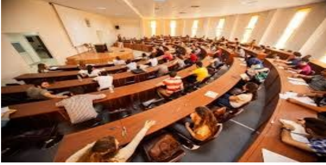
Türlerine Göre Mevcut Üniversite Sayısı

Genellikle fen, edebiyat, hukuk, tıp, mühendislik gibi alanlarda eğitim ve araştırma yapan fakültelerden oluşan yüksek öğretim kurumudur.