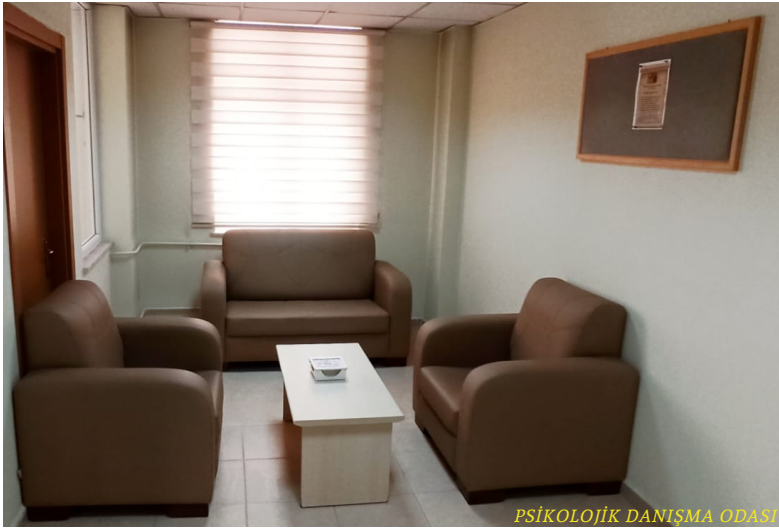
PSİKOLOJİK DANIŞMA ODASI

Bireylere kendini tanıma, karar verme ve problem çözme becerisi kazandırmayı, bireylerin kişisel ve toplumsal uyumlarını gerçekleştirmelerini ve iyilik hallerini geliştirmelerini amaçlayan, bireysel ve grupla profesyonel olarak yürütülen psikolojik yardım sürecidir.