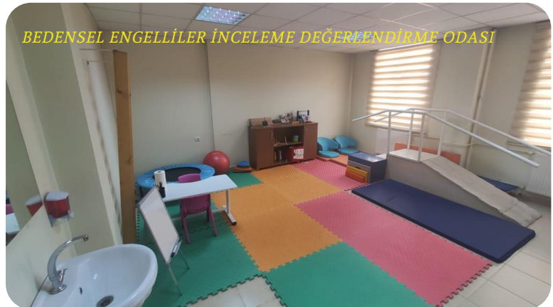
BEDENSEL ENGELLİLER İNCELEME DEĞERLENDİRME ODASI